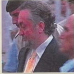
মিথ্যা মামলায় আসলতে নেয়া হচ্ছে হারুন ইয়াহিয়াকে

হারুন ইয়াহিয়া তুরেকের আংকারায় জন্মগ্রহণ করেন ১৯৫৬ সালে। হারুন ইয়াহিয়া নামে তিনি সুপ্রসিদ্ধ হলেও, এটি আসলে তাঁর ছদ্মনাম (pen- name) তাঁর পিতৃপ্রদত্ত নাম হচ্ছে আদনান ওকতার (Adnan Oktar)